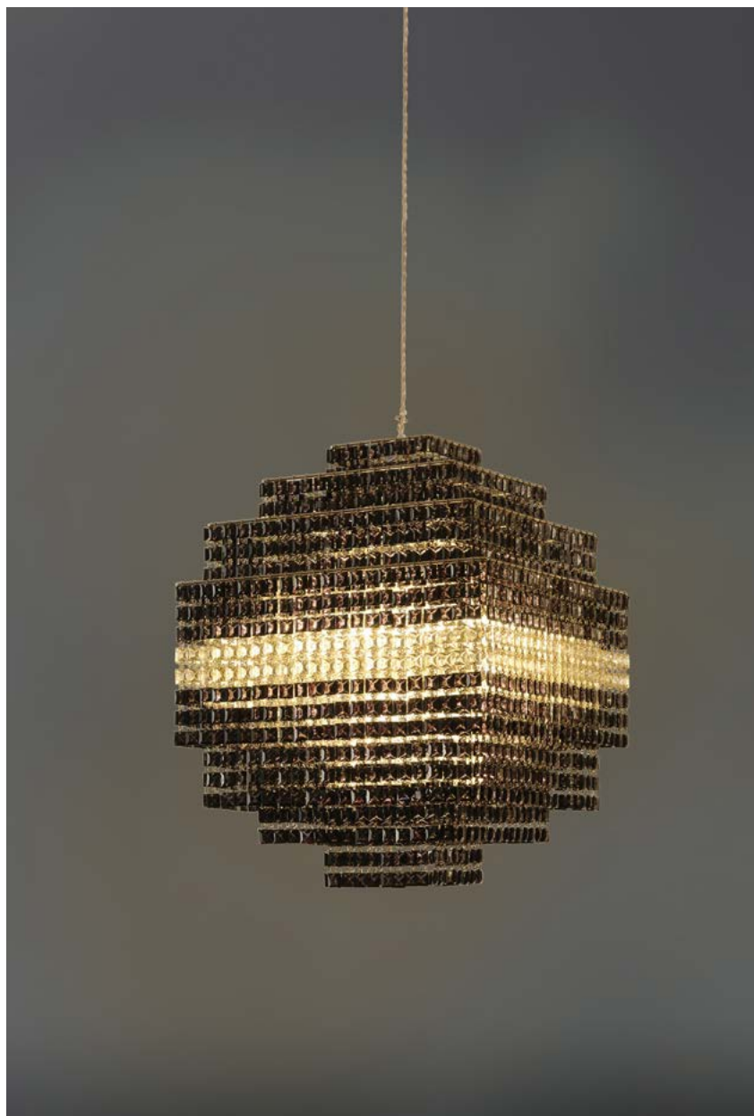
nella foto Phebo A.K.

Via Fratelli Vivarini 7, I-20141 Milano, Italy tel +39 02 895 023 42 fax +39 02 895 409 74 info@lollimemmoli.it www.lollimemmoli.it