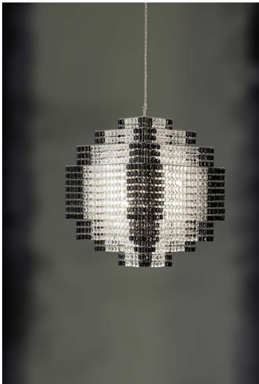
nella foto Phebo V.V.

Via Fratelli Vivarini 7, I-20141 Milano, Italy tel +39 02 895 023 42 fax +39 02 895 409 74 info@lollimemmoli.it www.lollimemmoli.it