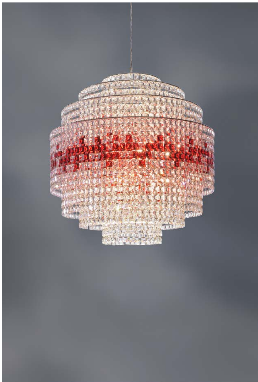
nella foto Phebo D.H.

Via Fratelli Vivarini 7, I-20141 Milano, Italy tel +39 02 895 023 42 fax +39 02 895 409 74 info@lollimemmoli.it www.lollimemmoli.it