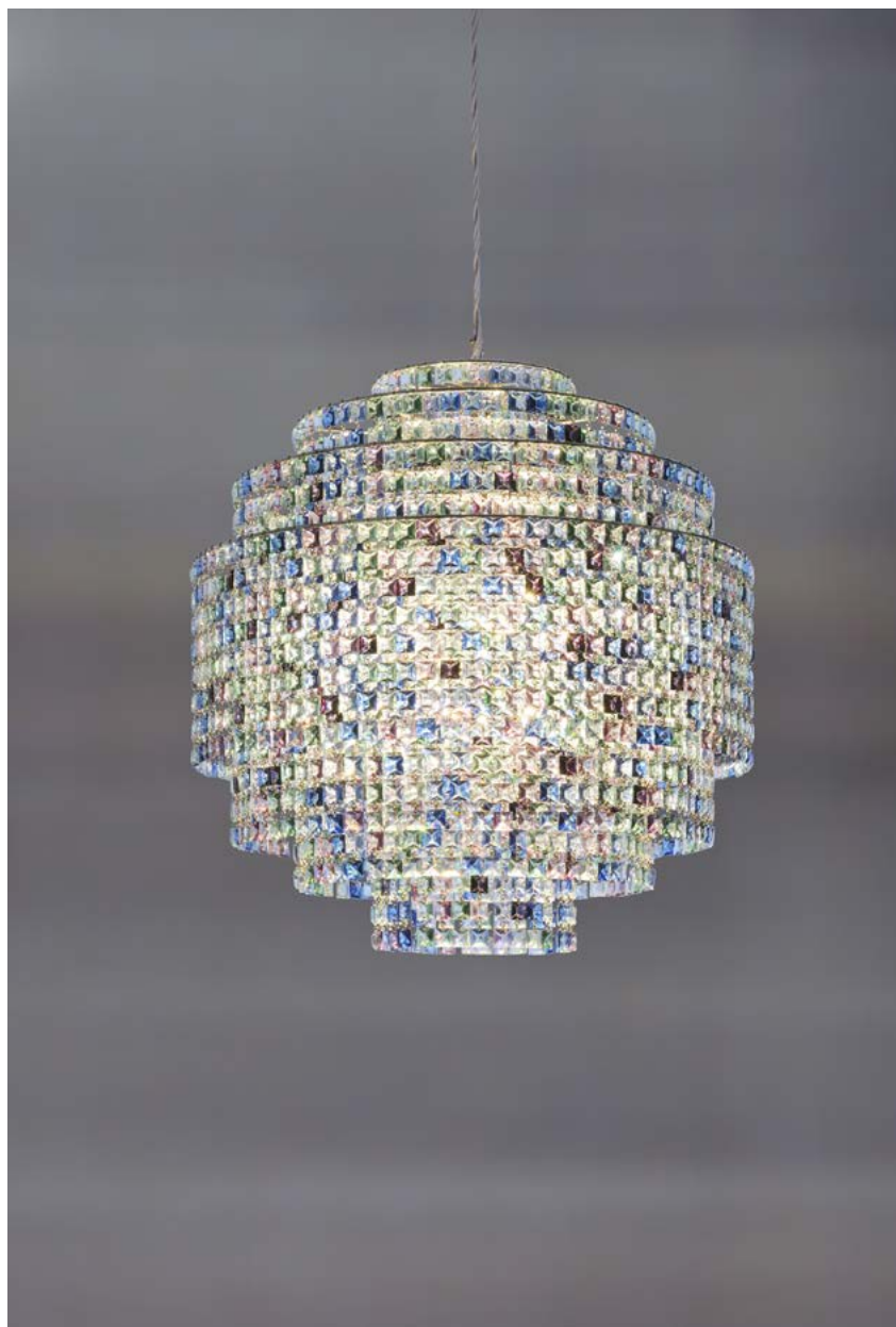
nella foto Phebo V.G.

info@lollimemmoli.it www.lollimemmoli.it